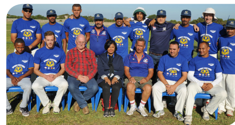
Hawston wen die krieket

Gansbaai het daarin geslaag om met die "Legen des" sokker-trofee vir die meer senior spelers weg te stap en Young Ideas het die sokkerfinaal teen iThemba gewen. Albei spanne is van Zwelihle.