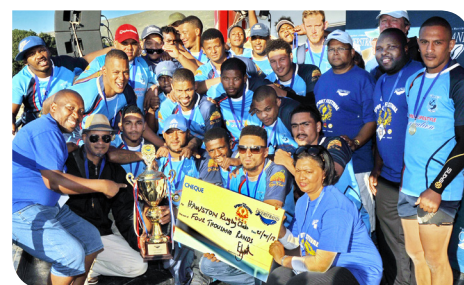
Hawston seëvier op die rugbyveld