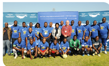
Gansbaai Legends stap weg met sokker-trofee