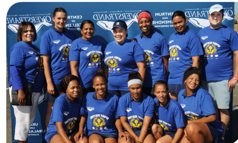
Mount Pleasant Netbal is waardige naasweners